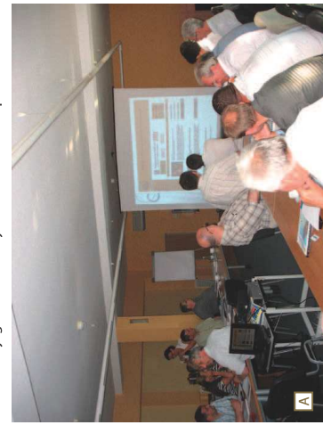
Fot. 2. Uczestnicy Walnego Zgromadzenia PIGR